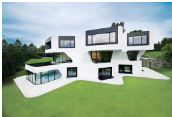
圖 3-1: 美學示意圖

資料來源：李志仁、蔡登傳、張朝旭(通訊作者)、宋同正，服務場域實體環境因子對消費者行為意圖之影響：以主題餐廳為例，科技學刊，22 卷 1 期，：2013 年 6 月 1 日。