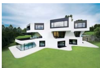
圖 3-1: 美學示意圖

資料來源：李志仁、蔡登傳、張朝旭(通訊作者)、宋同正，服務場域實體環境因子對消費者行為意圖之影響：以主題餐廳為例，科技學刊，22卷1期，：2013年6月1日。